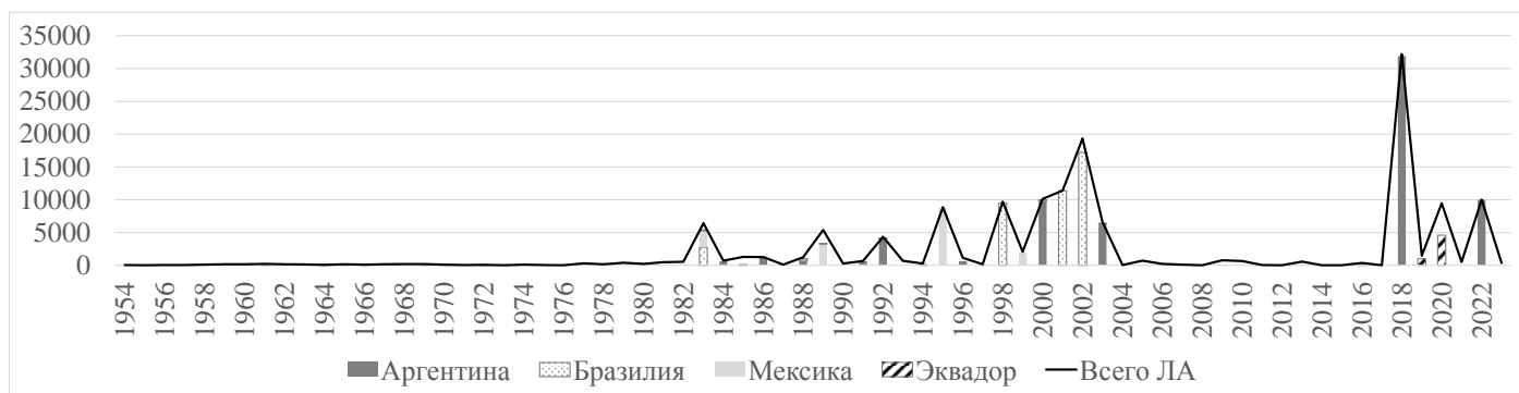
Рис.1. Объёмы кредитов, фактически выданных МВФ странам Латинской Америки, по дате одобрения (1954-2023, млн СДР)

Во второй главе дан обзор взаимодействия МВФ и стран ЛКА с фокусом на периодах активизации работы Фонда в регионе (Рис.1).